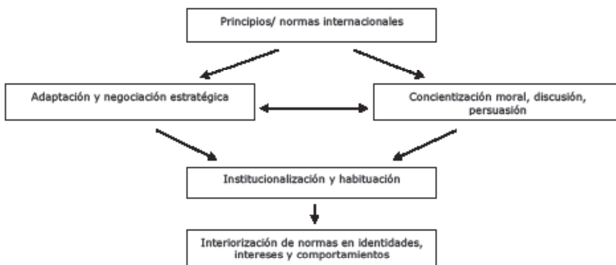
Figura 1.1 El proceso de socialización de las normas

Estos procesos constituyen los tipos ideales que difieren según su lógica subyacente o modo de acción e interacción social. En realidad, estos procesos normalmente toman lugar de forma simultánea. Nuestra tarea en este libro es identificar qué modelo de interacción es dominante en qué fase del proceso de socialización. Sugerimos un orden aproximado, representado en la figura 1.1.